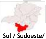
Sul / Sudoeste/ C. das Vertentes

Céu claro a parcialmente nublado com possibilidade de pancadas de chuva e trovoadas isoladas.