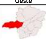
Triângulo/ Alto Paranaíba

Céu parcialmente nublado com pancadas de chuva e trovoadas isoladas.