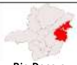
Rio Doce e Mucuri

Céu claro a parcialmente nublado com possibilidade de pancadas de chuva e trovoadas isoladas.