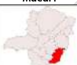
Zona da Mata

Céu claro a parcialmente nublado com possibilidade de pancadas de chuva e trovoadas isoladas.